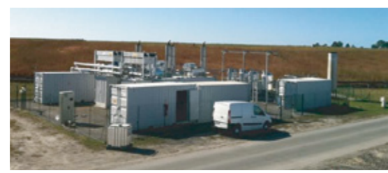
L'unité de valorisation du biogaz.

Economies financières. D'un point de vue économique, la présence de cette unité de valorisation limite l'augmentation de la TGAP (Taxe Général sur les Activités Polluantes) : en 2015, lorsque le TGAP aura atteint son plafond (40 euros par tonne enfouie), l'économie, pour le SMICOTOM et ses contribuables, sera alors de 500 000 euros par an.