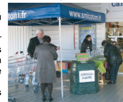
Le stand du SMICOTOM à l'entrée de l'hypermarché Carrefour de Lesparre.

Nous devons faire en sorte que ces résultats, bien qu'ils soient encourageants, s'améliorent dans un proche avenir.