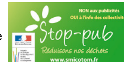
L'autocollant STOP-PUB du SMICOTOM

Comment obtenir un STOP-PUB ? L'autocollant STOP-PUB est disponible dans votre mairie, dans les déchèteries ou directement au bureau du SMICOTOM à Saint-Laurent Médoc.