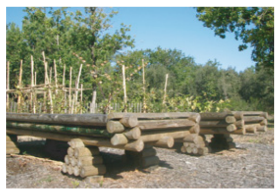
Le compost sert d'amendement pour le potager