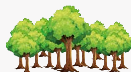
16 arbres préservés