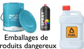
Emballages de produits dangereux