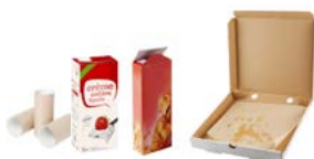
Emballages en carton