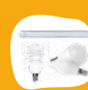
Lampes et néons