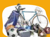
Articles sports et loisirs