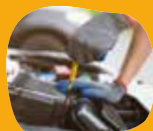
Huile de vidange