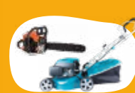
Articles de bricolage et jardinage thermiques