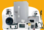
Déchets électriques et électroniques + cartouches d'encre